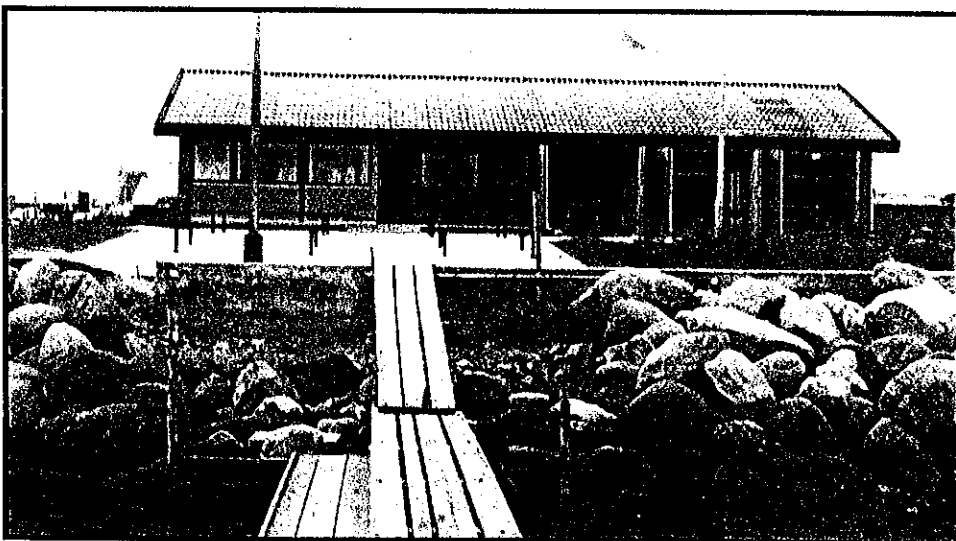
Horsens Kajakklub's Klubhus i 1977