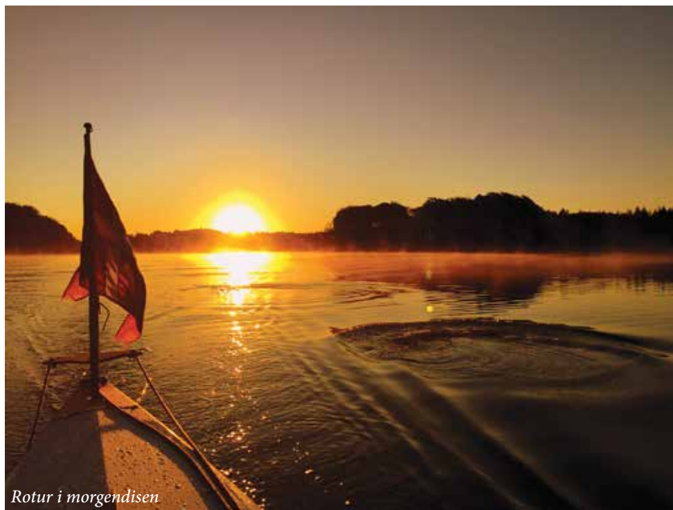
Rotur i morgendisken