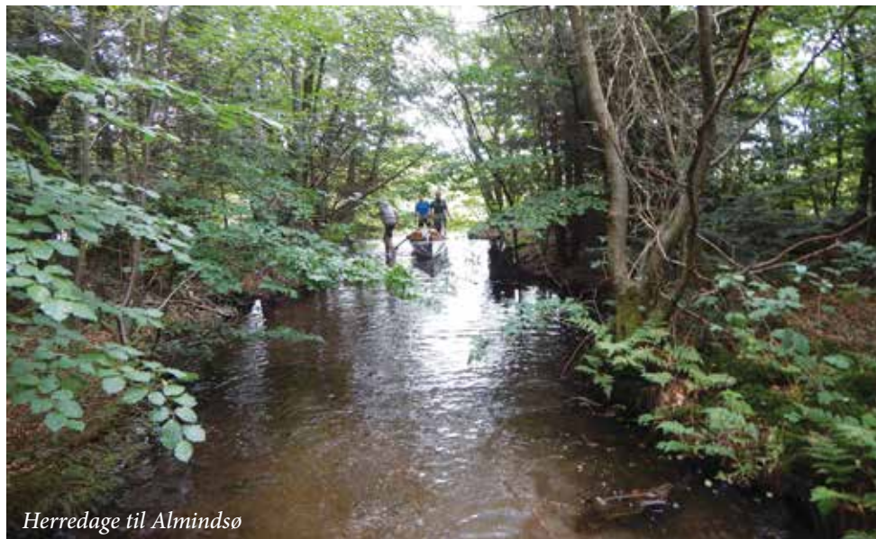
Herredage til Almindso