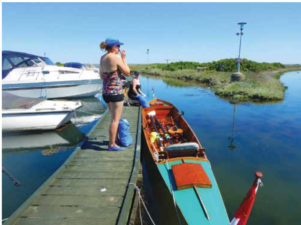
Langtur: Saksil - Nordminde - Aarhus