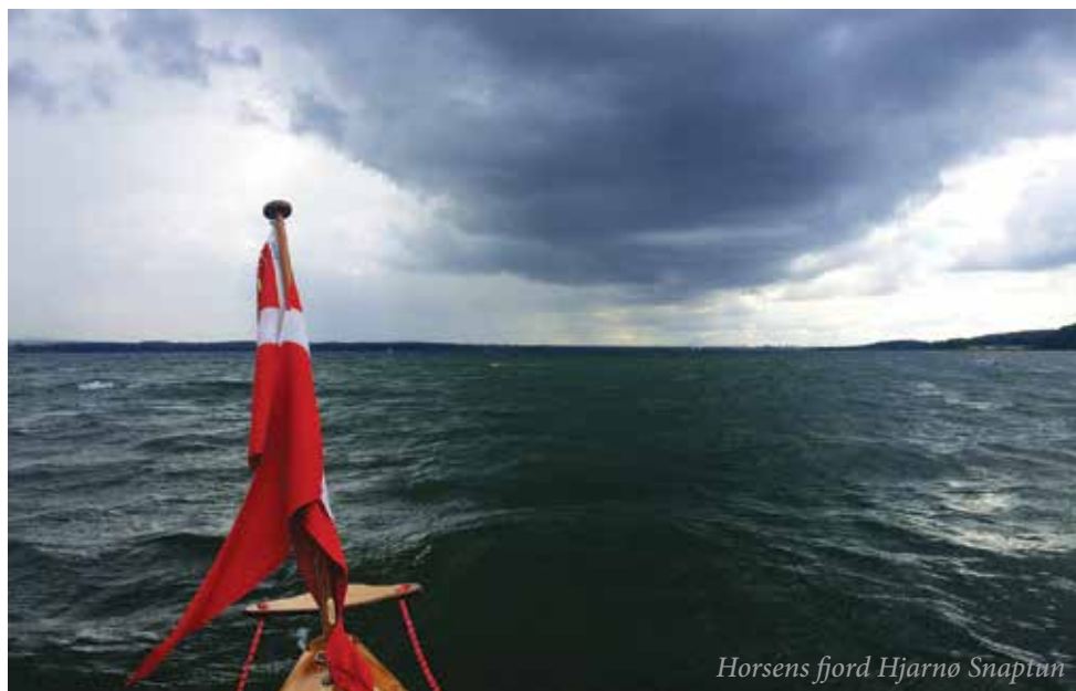
Horsens fjord Hjarnø Snaptun