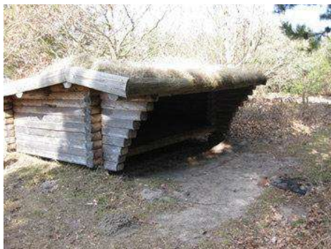
Shelteren ved skydebanen i Rørvig.

GPS-koordinaterne er dér hvor rasteplassen ligger.