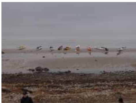
Stranden ved Kyndby Huse