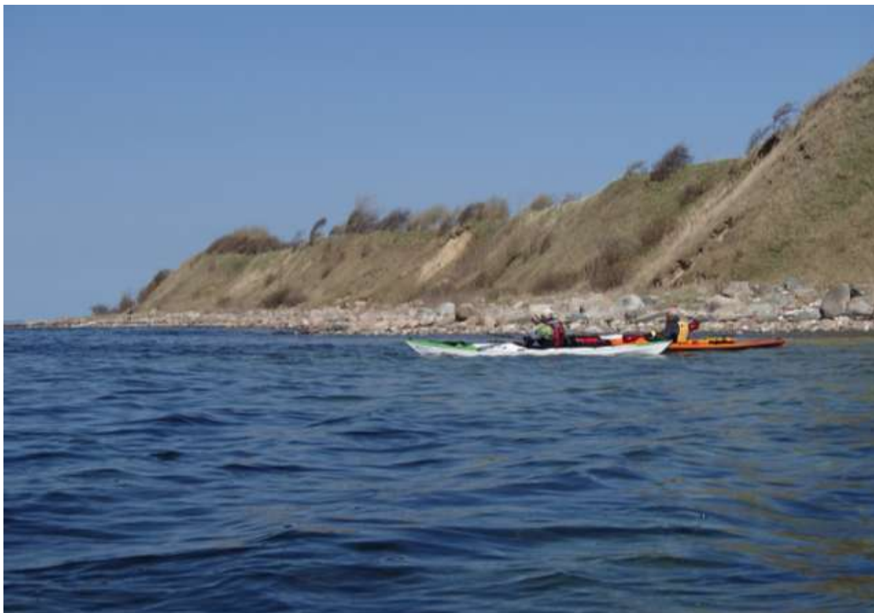
Over alt langs kysterne kan stenene langs stranden sætte sine aftryk på kajakkerne og Isefjorden er ingen undtagelse.