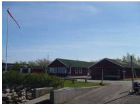
Holbæk Kajak Klub i Annekshavnen