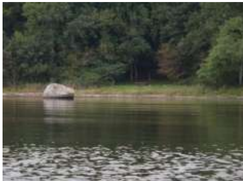
Lejrpladsen ved Stokkebjerg.

GPS-kordinaterne er dér hvor lejrpladsen ligger.