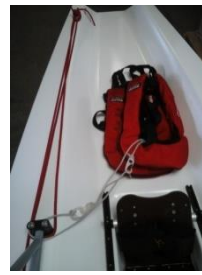
Placering i inriggerbåde.